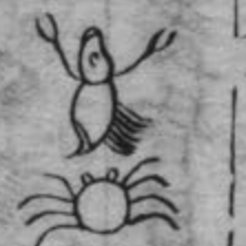
此蟲形如蝦蟹在人藏府中

已上諸蟲在人身中令人氣喘唇口多乾咳嗽 增寒心煩壅滿毛髮焦落氣脹吞酸津液漸衰 次多虛渴鼻流清水四肢將虛臉赤面黃皮膚 枯瘦腰膝無力背脊痠疼吐血唾膿語言不利 鼻塞頭痛胸膈多痰重者心悶吐血僵仆在地 不能自知其蟲遇庚辛日食起醉歸肺俞穴中