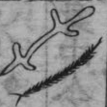
此蟲形如蝶或似守宮在人藏府中