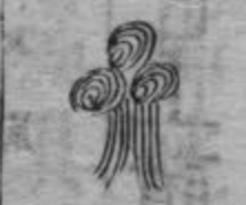
此蟲形如亂絲長三寸許在人藏府中